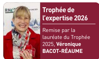
Trophée de l'expertise 2026

Senior advisor et expert à l'Institut l'épargne immobilière et foncière